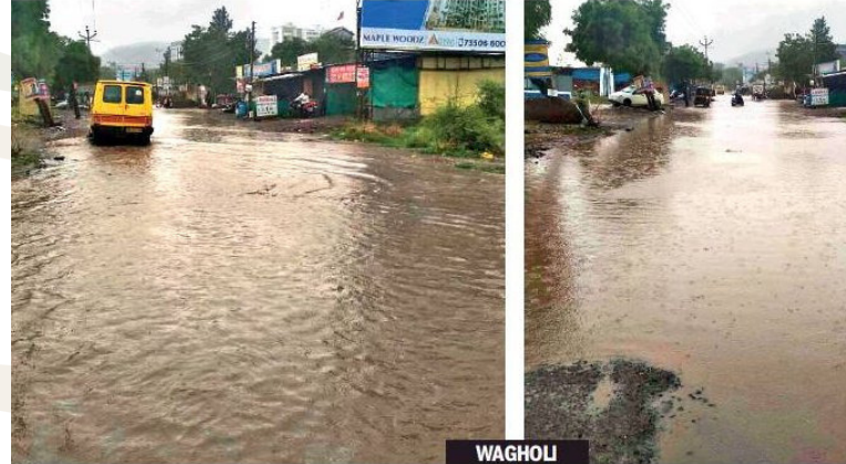
WAGHOLI DW CLAIMS: The civic authorities have been claiming in the run-up to the rainy season that they are monsoon prepared. But heavy shower left the entire Bakori road inundated. It was a pain for the pedestrians and also the motorists to use the road year it's the same story. Why do the authorities make such claims? – Siraj Dokadia