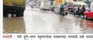
वाघोली : येथे पुणे-नगर महामार्गावर पावसाचे उजे शयने अचूक, वाहतूक कोंडी होऊ शकते पुणे-नगर महामार्गावर पावसामुळे तळ्याचे स्वरूप

वाघोली येथे नगर महामार्ग झाला तलाव येथील - वाघोली येथील नगर महामार्ग झाला तलाव. यातून पाणी निचरा होत नाही. यातून पाणी निचरा होत नाही. यातून पाणी निचरा होत नाही.